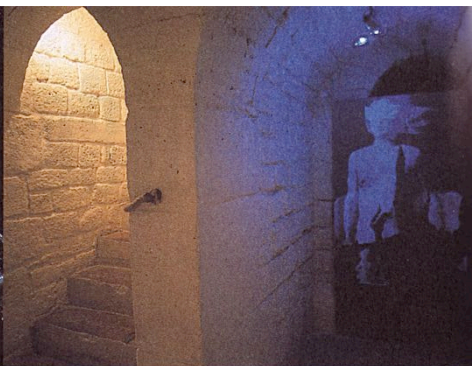
Η Κατερίνα Θωμάδου στο L' Enfant qui a pissé des paillettes.